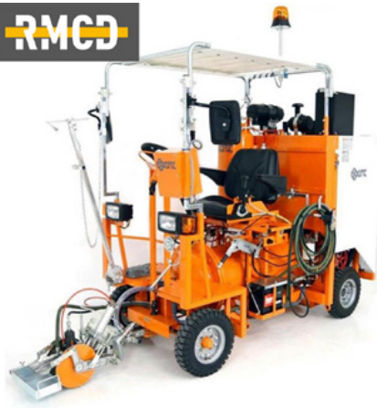
Airspray åkbara maskiner