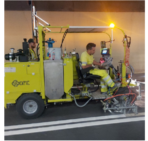
Airlösa åkbara maskiner