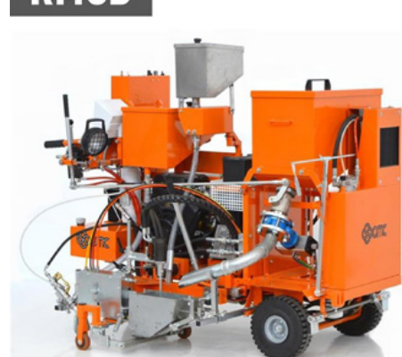
Hideg műanyag gépek