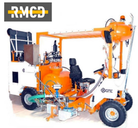
Hideg műanyag felhordó gépek