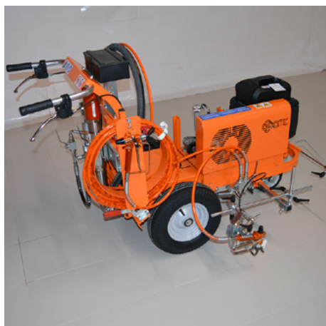
Elektromos airless gépek