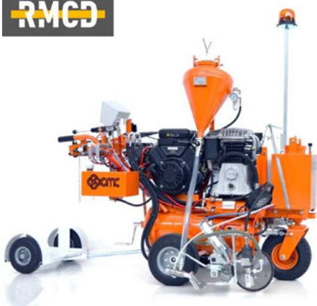
Légpermetező gépek hidraulikus meghajtással