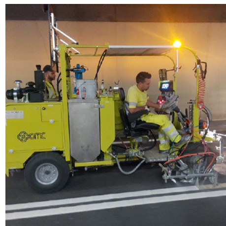
Légmentes felszálló gépek