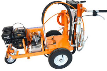
Havasız makineler el kılavuzlu