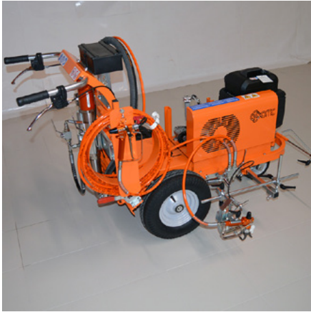
Elektrikli havasız makineler