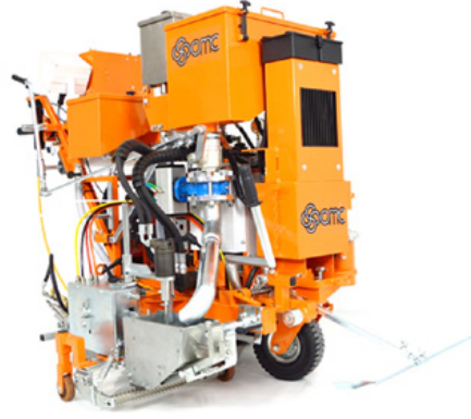
Hidrolik tahrikli sođuk plastik makineleri