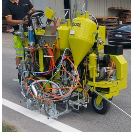
Hidrolik tahrikli havasız makineler