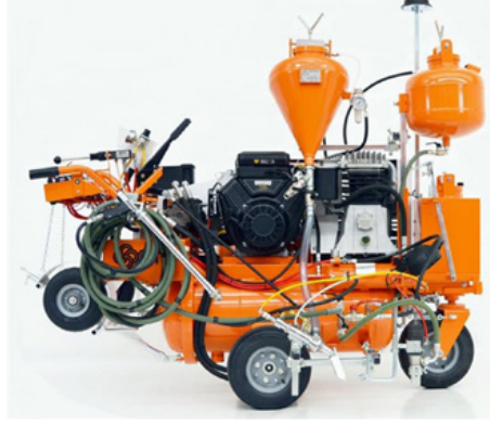
Hava Püskürtme Makineleri