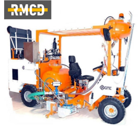
Cold plastik sürme makineleri