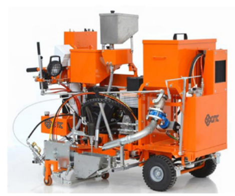
Cold plastik makineleri