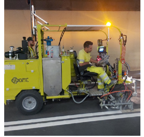
Havasız sürüş makineleri