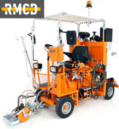
Airspray sürüş makineleri