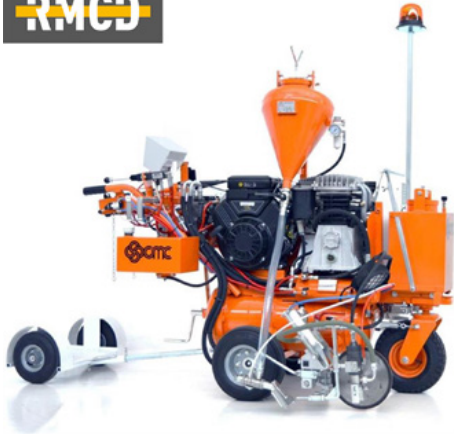
Hidrolik tahrikli hava püskürtme makineleri