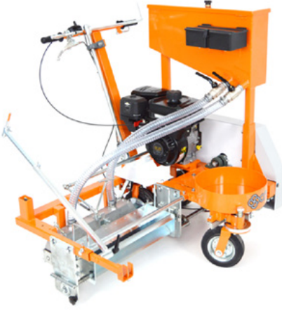
Kayıř tahrikli sođuk plastik makineleri