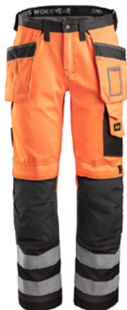
Pantalons classe 2