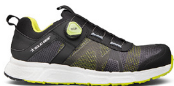
Chaussures de travail et de sécurité