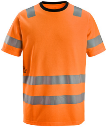
T-paidat ja collegepaidat