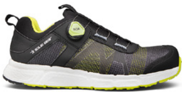
Zapatos de trabajo y de seguridad