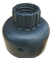
Akcesoria do słupków Flexipost