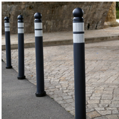
Borne de ville Bala