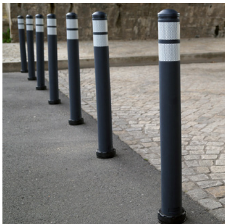
Borne de ville Kapa